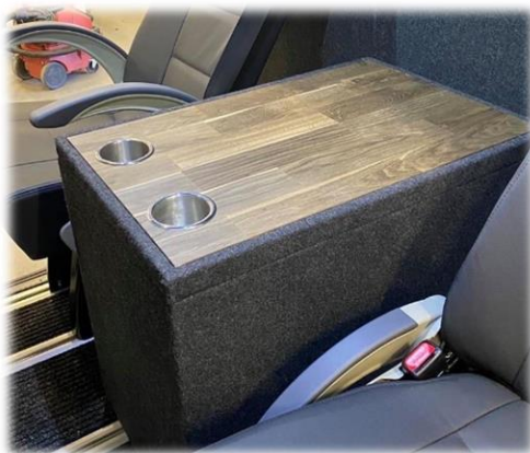
Bord LOUNGE med förvaring klädd i SN textil Dark Grey, massiv ekskiva inkl. 2st nedfällda mugghållare i crome.