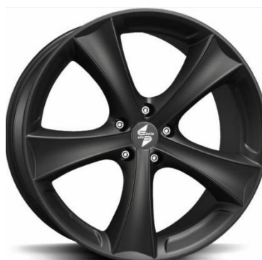
Fälgpaket 18'' med C-däck, svarta. (SN sänkningssats ökar bilens komfort och köregenskaper)