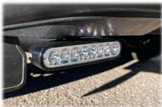
Arbetsljus/backljus under stötfångare. Kopplade via 3-lägesbrytare i hytt. (finns även med integrerat blytljus)