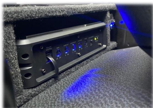
Ljudpaket med 8'' eller 10'' bas, kopplas över originalradion. (alla originalhögtalare byts ut)