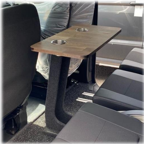
Bord PLAIN på stativ klädd i SN textil Dark Grey, massiv ekskiva inkl. 2st nedfällda mugghållare i crome.