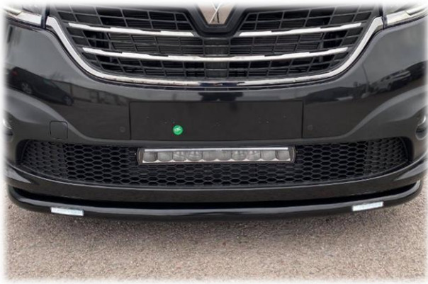
Frontrör DRL LED i valfri kulör (pulverlack)