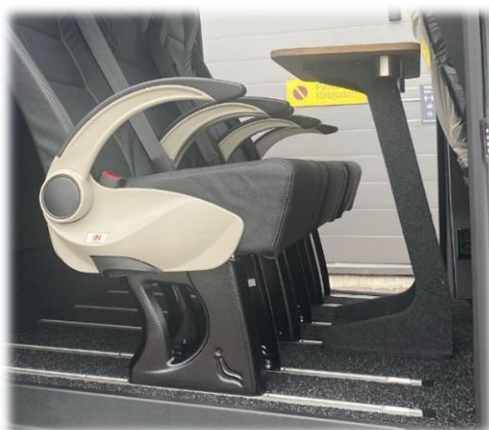
Armstödspaketet för högre komfort.

Vi erbjuder också en mängd olika tillval anpassade efter ditt behov. Nedan finner du några av våra populära tillval.