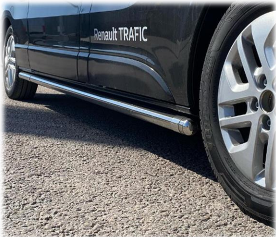
Sidebars i valfri kulör. (pulverlack)