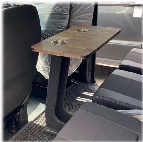
Bord PLAIN på stativ klädd i SN textil Dark Grey, massiv ekskiva inkl. 2st nedfällda mugghållare i crome.