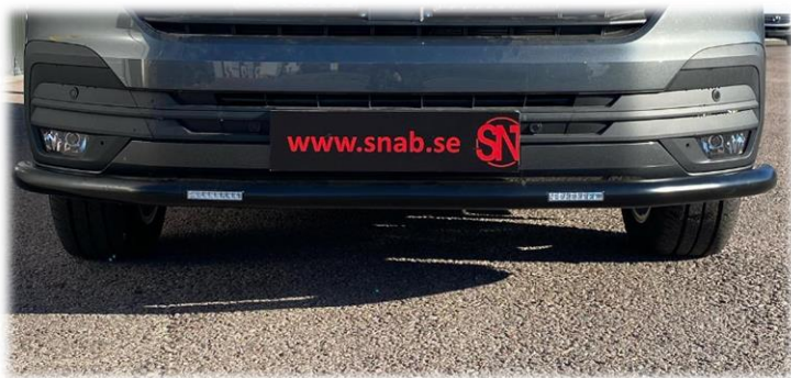
Frontrör DRL LED i valfri kulör (pulverlack)