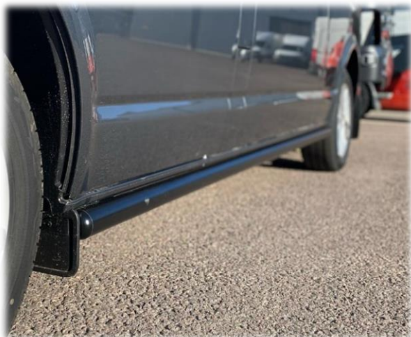
Sidebars i valfri kulör. (pulverlack)