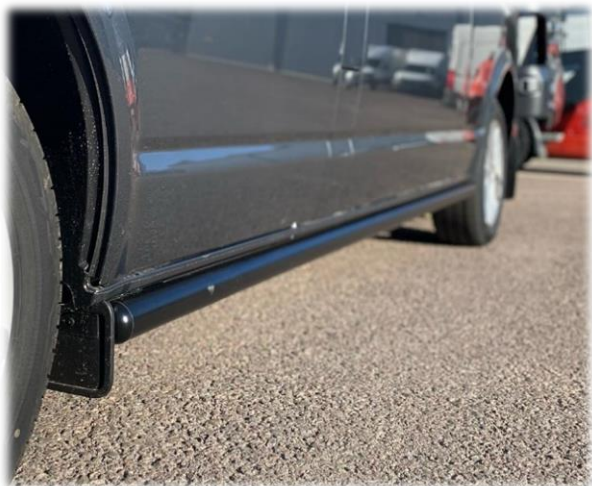
Sidebars i valfri kulör. (pulverlack)