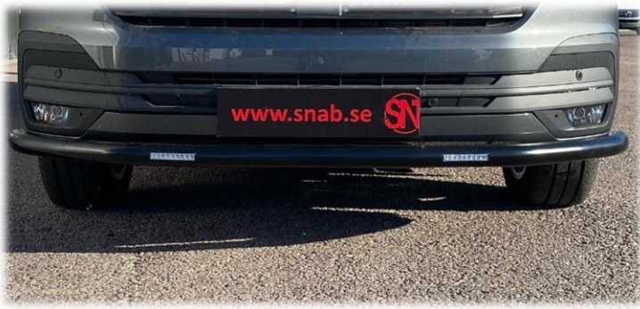
Frontrör DRL LED i valfri kulör (pulverlack)